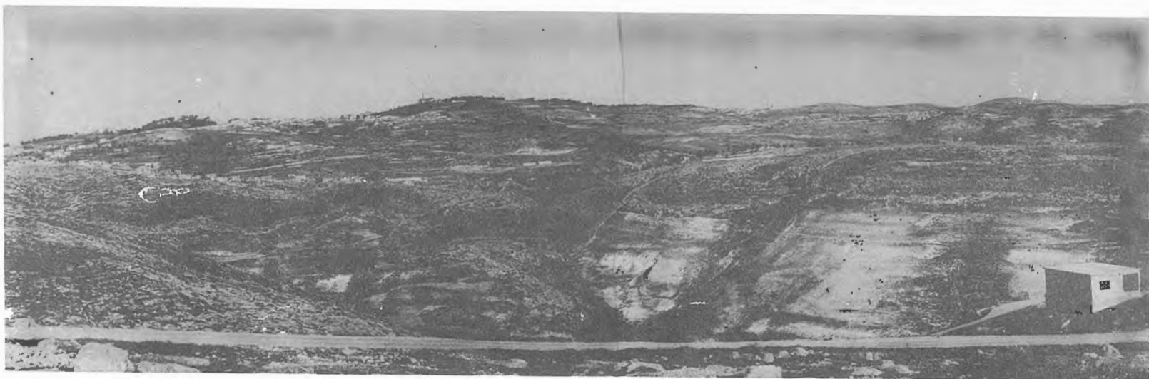
תצלום מס. 1: תחנה מס. 1 מבט פנורמי לכוון מערב