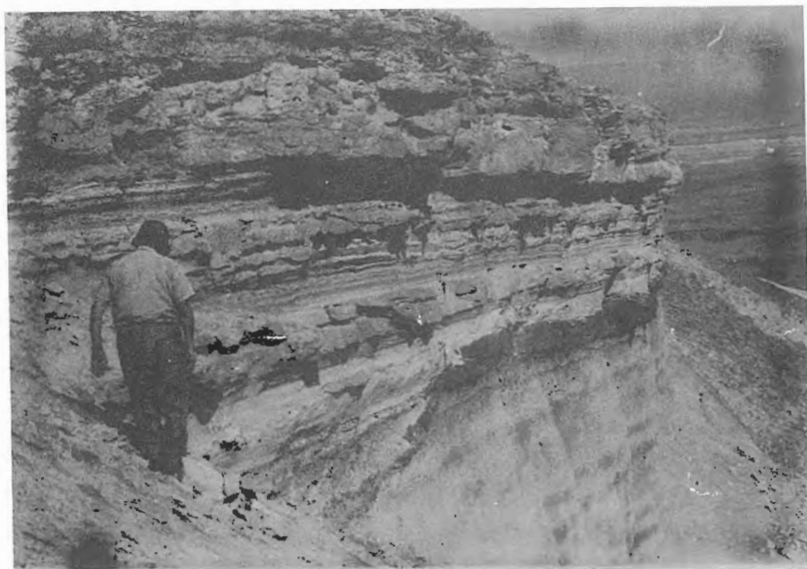
תצלום מס. 2 ג'בל קובליה, מחשוף של תצורת סמרא, קונגלוסרטים וגיר אואוליסי מגיל פליוקן? - פלייסטוקן.